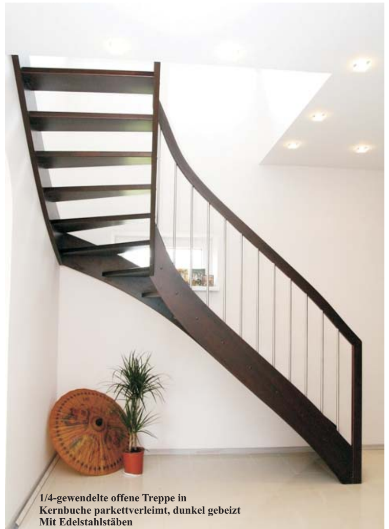
1/4-gewendelte offene Treppe in Kernbuche parkettverleimt, dunkel gebeizt Mit Edelstahlstäben