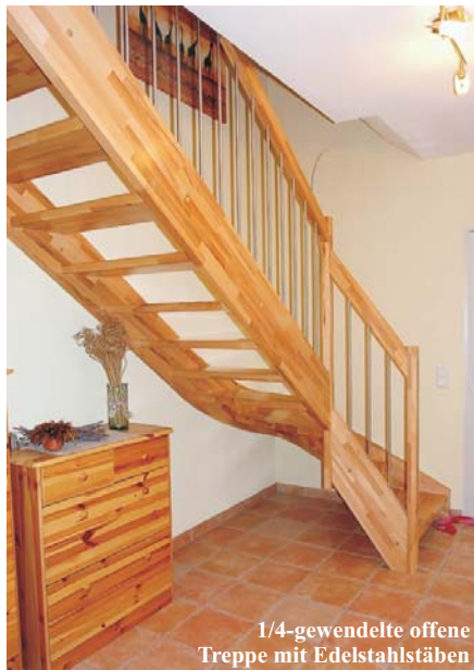
1/4-gewendelte offene Treppe mit Edelstahlstäben

Preise für eine komplette Treppe in Buche keilgezinkt naturbunt, incl. 19% MwSt., incl. Aufmaß, Lieferung und Montage im 50 km-Umkreis von Frankfurt /M.