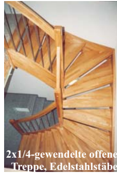
2x1/4-gewendelte offene Treppe, Edelstahlstäbe