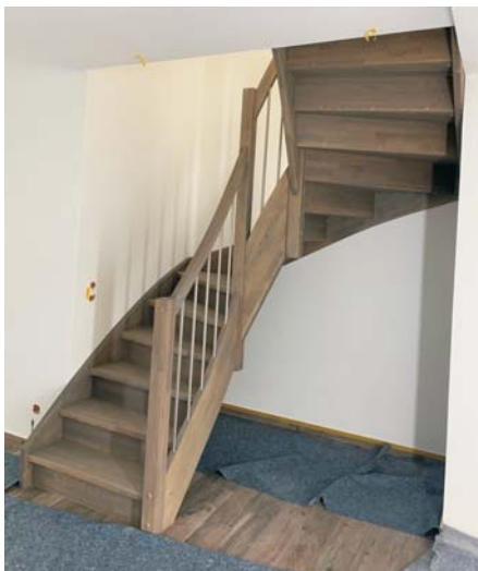
2x1/4-gewendelte geschlossene Treppe in Buche keilgezinkt, farbig geölt Mit Edelstahlstäben

Preise für eine komplette Treppe in Buche keilgezinkt naturbunt, incl. 19% MwSt. Incl. Aufmaß, Lieferung und Montage im 50 km-Umkreis von Frankfurt /M.