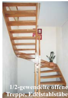
1/2-gewendelte offene Treppe, Edelstahlstäbe