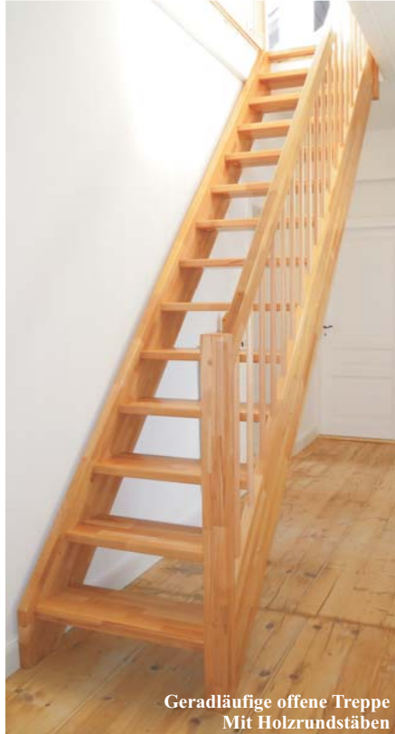
Geradläufige offene Treppe Mit Holzrundstäben

Handwerkliche Maßanfertigung aus Massivholz nach DIN 18334. Hergestellt in Deutschland. Beidseitig eingestemmte Wangentreppe. Stufen-, Wangen- und Handlaufstärke ca. 40 mm. Geländer aus glatten Holzrundstäben Ø ca. 25 mm oder Edelstahlstäben Ø ca. 16 mm, glatten An- und Austrittspfosten ca. 80 x 80 mm oder 80 x 40 mm und glattem Holzhandlauf ca. 80 x 40 mm. Offene Ausführung, ohne Setzstufen. Treppenbreite bis 95 cm. Auftrittsbreite bis 26 cm. Alle Holzteile werden sauber geschliffen und oberflächenfertig versiegelt.